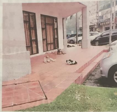
BEBERAPA ekor anjing liar berkeliaran di hadapan sebuah bank di Bandar Puteri Puchong, Puchong.

"Saya lihat bilangan anjing liar yang berkeliaran di kawasan tersebut makin bertambah. Saya bimbang sekiranya tidak ditangkap ia boleh menyebabkan kejadian tidak diingini seperti yang berlaku ke atas saya," ujarnya.