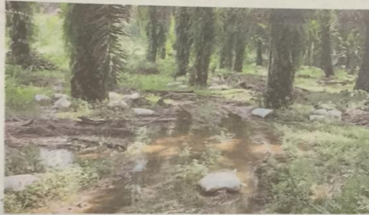
Beg dipercayai berisi najis babi bersepah di kawasan ladang sawit Kampung Kuala Gepai Tambahan, Bidor.

Penduduk, Nordin Khalipah, 57, berkata sejak 10 tahun membina rumah di tanah lot ini, dia sudah lali dengan bau kumbahan najis babi yang hanya 400 meter dari rumahnya.